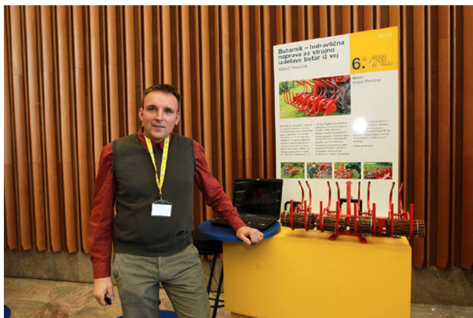
Butarnik je inovacija, ki omogoča preprosto izdelovanje butar s pomočjo traktorske hidravlike.

Inovatorji so z izplenom šestega Slovenskega foruma inovacij (SFI), ki je prejšnji teden potekal v Ljubljani, zadovoljni. Nekateri svoje izdelke že tržijo, druge ta preizkus še čaka.